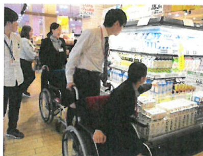
【企業向け福祉教育の一場面】