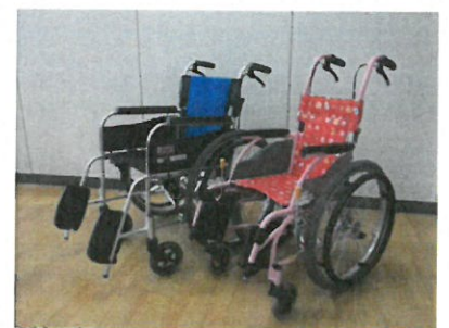
【無料貸し出し用車いす】