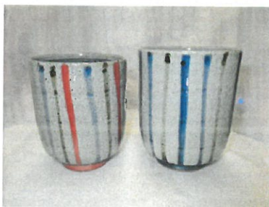
【金婚お祝い会 記念品】