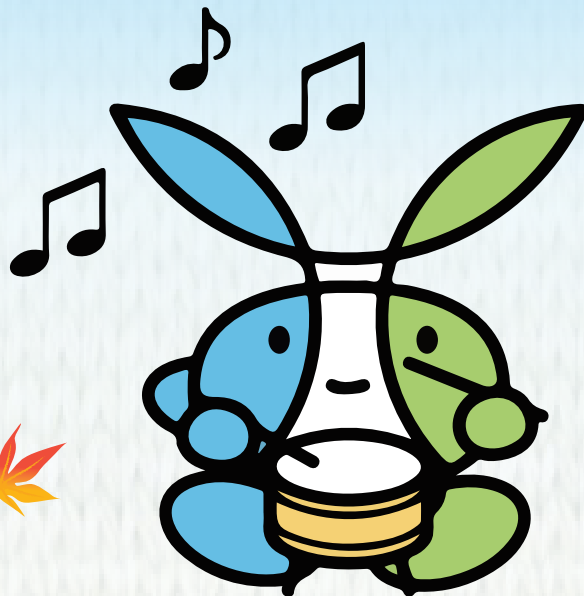
西区マスコットキャラクター 「にっしー」