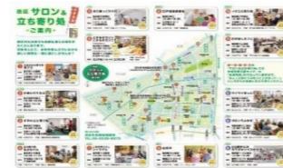
西区サロン& 立ち寄り処マップ