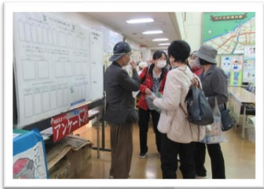
アンケートの案内