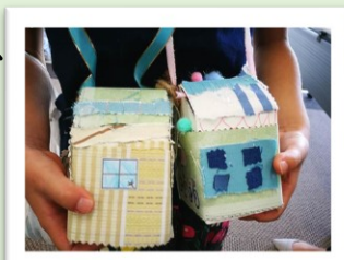
端切れの材料で作った「おうちカバン」

捨てられる端切れが材料になり、 ひと手間をかけることで子どもたち の工作への世界が広がるきっかけに なればとの願いがあります。