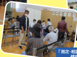
「測定・相談ができる健康コーナー」健康チェックコーナー