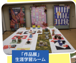
「作品展」生涯学習ルーム