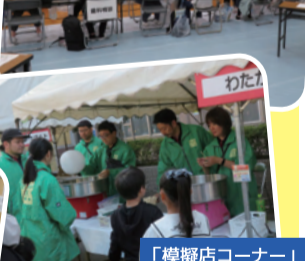
「模擬店コーナー」地域活動団体