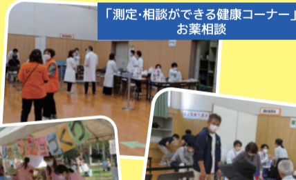
「測定・相談ができる健康コーナー」お薬相談