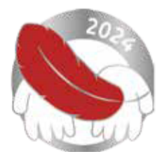
記念バッジイメージ図

令和6年度赤い羽根共同募金を10月1日～12月31日の期間に実施する予定です。地域・学校・会社などを通じてご案内をさせていただきます。西区社会福祉協議会の窓口や西区役所には募金箱を設置します。また、年度ごとにデザインが変わる記念バッジもバッジ募金として1個500円でご用意させていただきます。どうぞみなさまのご協力をお願いします。