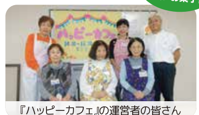
『ハッピーカフェ』の運営者の皆さん

令和6年11月、新しいサロン『ハッピーカフェ』が広教地域にオープンしました！運営者はエピシオン阿波座振興町会の住民の皆さんです。カフェを通して認知症の方とその家族の支援もできるように研修を受け、「ちーむオレンジサポーター」となりました。認知症カフェの登録もしています。