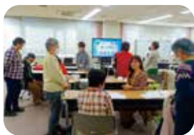
傾聴のロールプレイング

令和7年2月に「こころに寄り添う はじめての傾聴ボランティア養成講座」(全3回)を開催しました。定員を超える多くの応募があり、傾聴への関心の高さが感じられました。