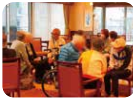
高齢者施設で傾聴ボランティアを体験

地域では孤独を感じている高齢者も多くおり、傾聴ボランティアが求められています。地域住民が自分が住む地域の誰かのためにやりがいをもって活動ができるよう、今後もサポートをしていきます。